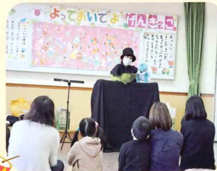
よっておいでよげんきっ子

市内の「げんきっ子」が集まって、おうちの人と一緒に体操やゲーム、工作をしたりして、みんなで楽しく遊んでいます。対象年齢の兄弟・姉妹なら、赤ちゃんから小学生まで一緒にどうぞ。市外の方も参加OK！皆さんのご参加お待ちしております。