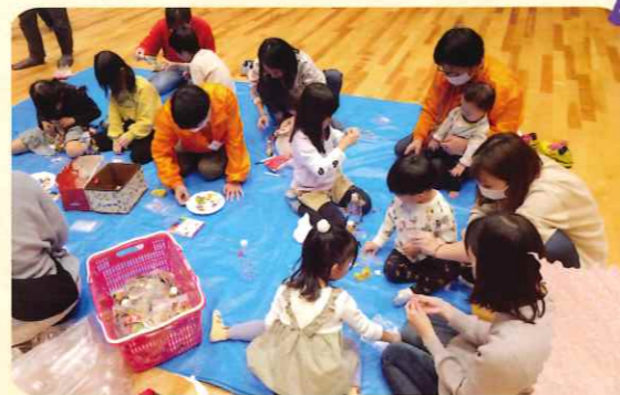
よっておいでよげんきっ子