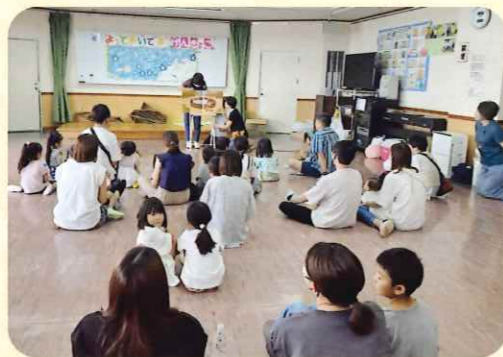
よっておいでよげんきっ子