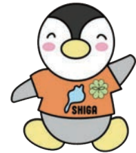
滋賀県民生委員・児童委員 キャラクター 『びわっ湖 ミンジー』