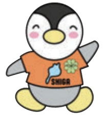
滋賀県民生委員・児童委員 キャラクター 『びわっ湖 ミンジー』