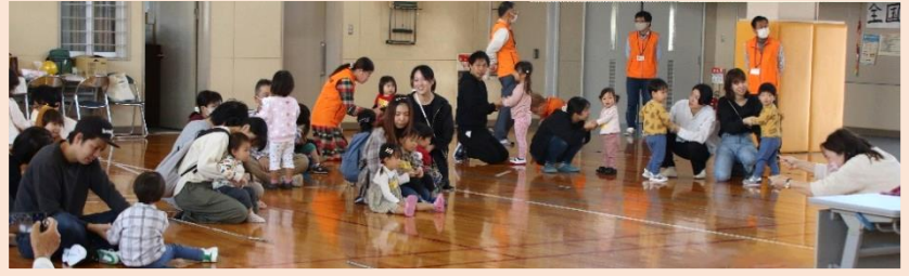
〈親子で楽しむリトミック〉