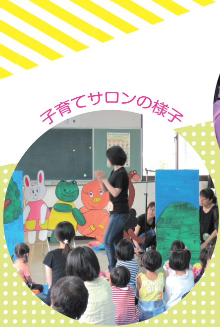
子育てサロンの様子