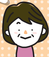
1 期目 民生委員・児童委員

地域の皆さんや委員の仲間のお力で、色々な事を学び自分自身の成長にもつながっています。地域住民の方が安心して生活いただけるよう、寄り添っていきたくと思います。