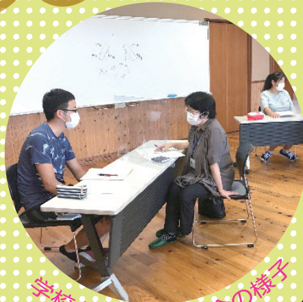
学校との情報交換会の様子