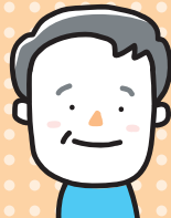
2 期目 民生委員・児童委員

民生委員・児童委員を受けて8年目になり、地域住民の身近な相談相手として行政へのつなぎ役、住民の見守り活動を行っています。皆さんからいただく「ありがとう」の声が活動のやりがいと励みになって日々頑張っています。