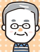
3 期目 民生委員・児童委員

赤ちゃん訪問や幼児の集い等で、子どもや保護者さんの笑顔に出会えるとホッとして嬉しくなります。直接のお出会いが難しい状況ですが、子育て中の方のお役にたてる事が少しでも出来ればと思っています。