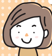
1 期目 主任児童委員

人に話しにくい事を聞いていただき、ありがとうございます。困った時、すぐに相談できるので安心です。