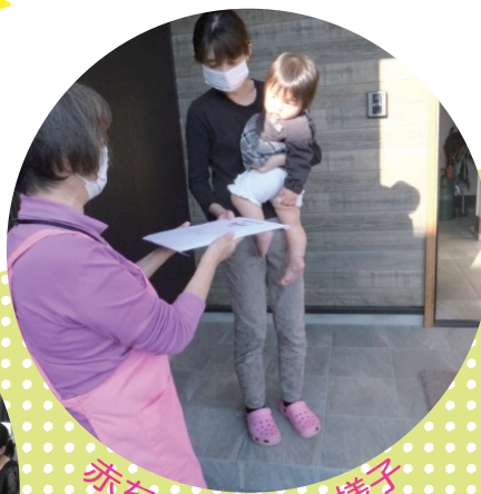
赤ちゃん訪問の様子