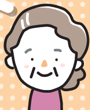
地域住民(一人暮らし高齢者)

子どもの事を気軽に相談でき、悩んだり落ち込んだりした時にもじっくり話を聞いてくれる民生委員さんは、お母さんのような存在です。地域の子もたちのために熱心に動いてくださり、必要な情報をいち早く届けてくれるので、安心して子育てしています。