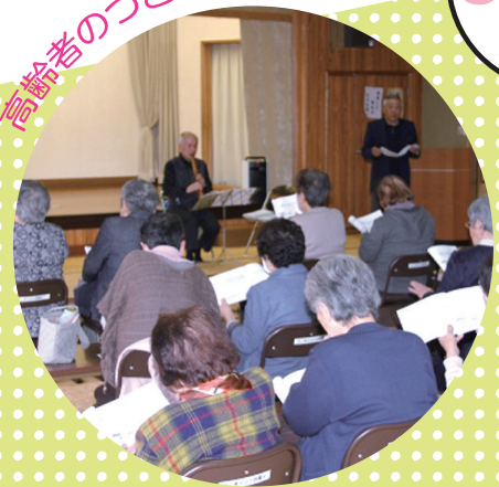
高齢者のつどいの様子