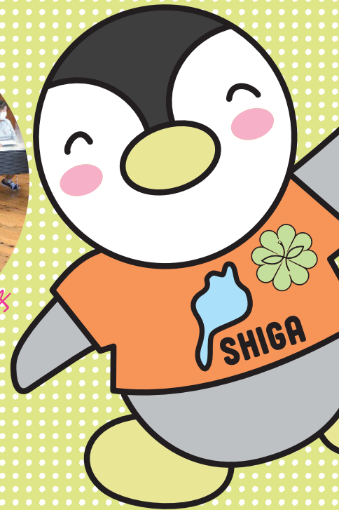
滋賀県民生委員・児童委員キャラクター 【びわっ湖ミンジー】