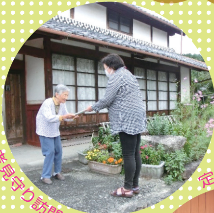
高齢者見守り訪問の様子