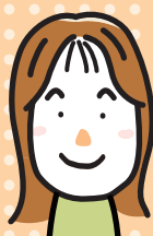
地域住民 子育て中保護者